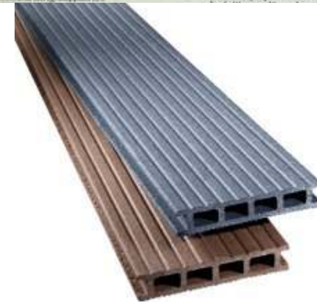
Kuva: Puumuovi-komposiitit UPM PROFI DECK