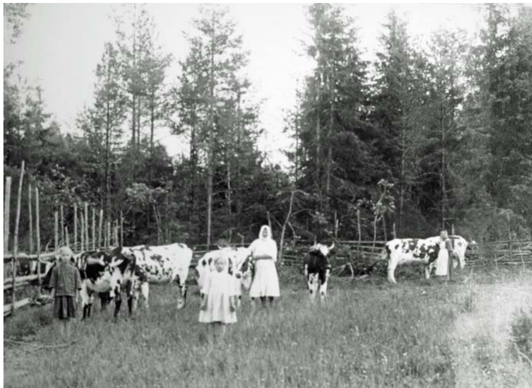
MÄNTSÄLÄ KOMMUNS BILDARKIV: VILJAMAA

Både blåbär och lingon plockades i skogarna i hela Finland. Svamparna har inte varit en lika naturlig del av födan i västra Finland som i östra delarna av landet. Upplysningsverksamheten om svampar och inflyttningen österifrån ändrade småningom den lokala matkulturen också i landets västliga delar.