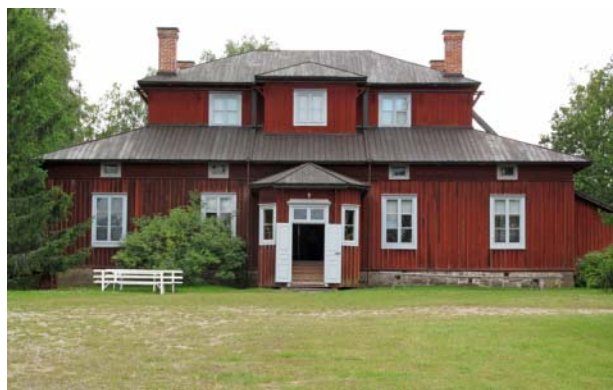
Alikartanos nya karaktärsbyggnad byggdes år 1805 och fungerar idag som museum.

Torparen betalade sin hyra i dagsverken. I början av 1900-talet bestod ett dagsverke av 13 arbetstimmar. Då man räknar med resetiden blev det inte många timmar kvar av dagen för torpets egna arbeten. På ett större torp var plikten att utföra dagsverken tre dagar i veckan och utöver detta 30 separata hjälparbetsdagar.