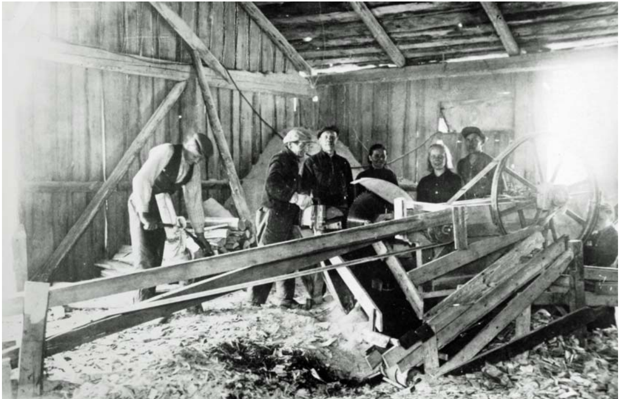
MÄNTSÄLÄ KOMMUNS BILDARKIV/P. AVOMERIS SAMLING

På Linnais och Kassila herrgårdar fick karelarna tillfälligt husrum i förplägningsmännens bostäder. Senare utbröt man jord och skog åt dem från gårdens marker. De røjde upp sina husplatser mitt i urskogen med stor strävan och mycket flit. De byggde vackra hem och födde upp både kor och hästar. De slog gräset längs vägrenen och vallade sina kor i en rad längs vägrenen. XV, 24.