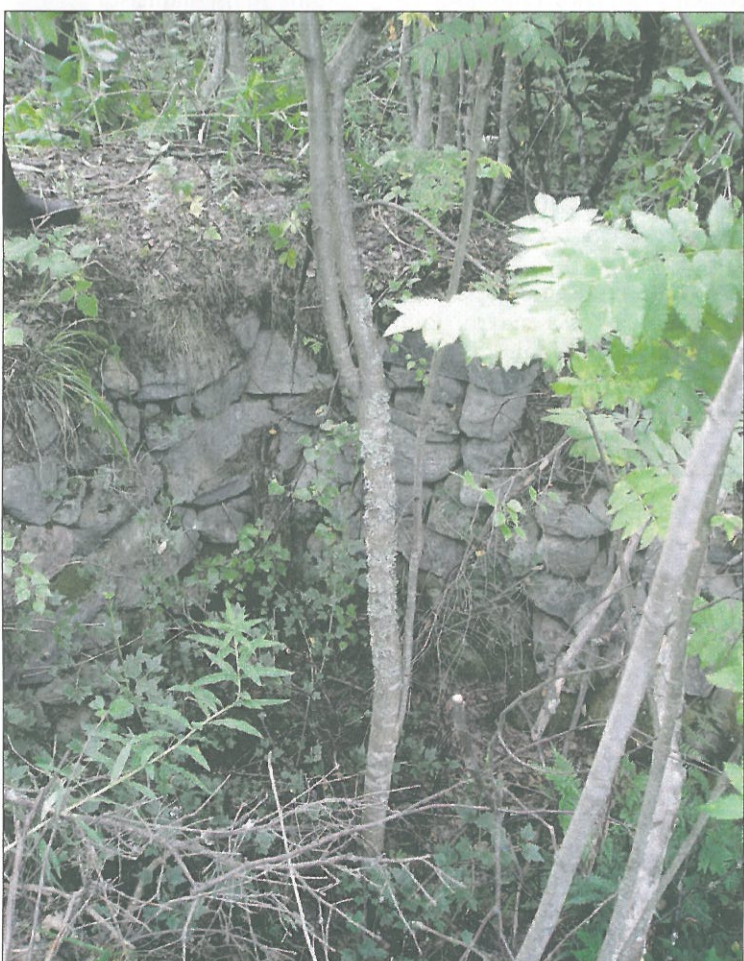
Maakellarin jäänteet Mäntsälän Sääksjärveltä oli yksi yli kahdesta sadasta Mäntsälässä kartoitetusta metsäkuultuurikohteesta.