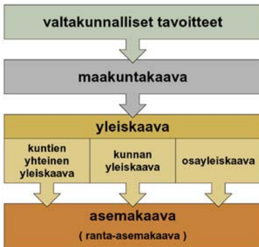
Kuva 1. Kaavoitusprosessin eri tasot Suomessa.

Maisematyö lupa tarvitaan muun muassa puiden kaatamiseen asemakaava-alueella, yleiskaava-alueella, jos yleiskaavassa niin määrätään sekä alueella, jolle on määrätty kaavassa toimenpiderajoitus. Lupaa ei tarvita vaikutuksiltaan vähäisiin toimenpiteisiin eikä yleensä silloin jos toimenpide on hyväksytty jollakin muulla luvalla. Hakijan on ilmoitettava hakemuksen vireille tulosta naapureille, jollei ilmoittaminen hankkeen vähäisyys tai sijainti huomioon ottaen ole naapurin edun kannalta tarpeeton.